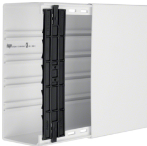
Goulotte FB 100x230mm PVC blanc