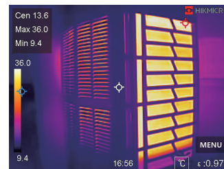
Chauffage, Ventilation & Climatisation